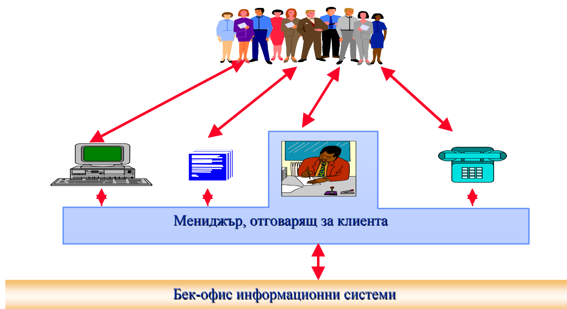
Фигура. Концептуално представяне на обслужването на “едно гише”